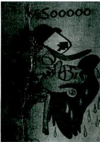
Imagen No. 2 Folio. 24

"(...) Mientras siga controlando el cuerpo de Dipper, voy a escribir acerca de algo REALMENTE interesante: ¡mi novio-pezu a larga distancia, Marmando! (...) Supongo que no estoy siendo muy justa con mi hermano. Le salvó la vida a Marmando con ese beso (...)"