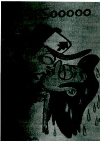
Imagen No. 1 Folio. 24

Y continúa: "(...) Pero ¿debo dejar que se quede con este increíble cuarto nuevo? ¡Sobre mi cadáver! ¿o el suyo? ¿Sobre mi cadáver con su cerebro muerto adentro? Olvidalo."