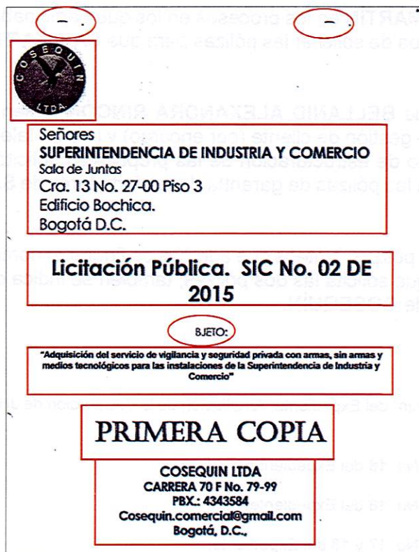
Imagen No. 3: Portadas de COSEQUÍN y SAN MARTÍN en el proceso SIC-02-2015

Por su parte, en las portadas de las propuestas de las empresas investigadas en el proceso SIC-02-2015 adelantado por la Superintendencia de Industria y Comercio, se advirtieron abiertas similitudes, tales como contener ambas el mismo error al redactar la palabra objeto (BJETO), las mismas marcas de impresión, el mismo esquema de alineación y contenido y unas "manchitas" en la parte superior 43 :